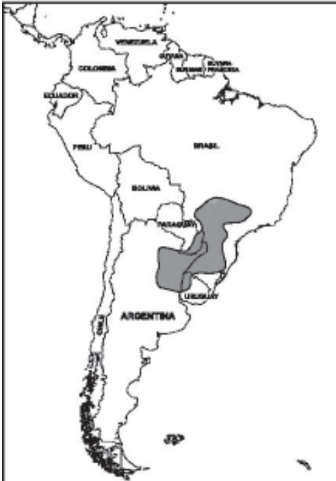
Fig. 1: UBICACIÓN EN LOS 4 PAÍSES

a 40.000 km 3 , volumen suficiente para abastecer a la población mundial actual (6.000 millones) durante unos 200 años, a una tasa de 100 litros/día por habitante.