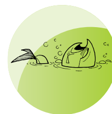
O lugar onde antes o povo pescava já não é mais farto de peixe.

O policial federal aposentado Tavera, de 72 anos, vive há 28 no Vale. Para ele, é imprescindível parar com a degradação do rio. Ele explica que faz aproximadamente quatro anos que estão invadindo tudo e jogando lixo no rio. “As pessoas estão invadindo as áreas verdes do templo. O governo mesmo invade as áreas religiosas [verdes]. Se faltar água, a Estrela [do templo] fica incompleta”.